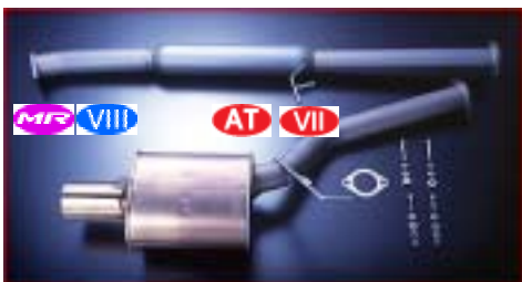
RACT9101S ステンレスマフラー