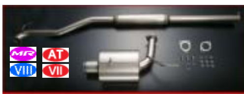
RACT9101T1 RALLIARTチタン製超軽量マフラー